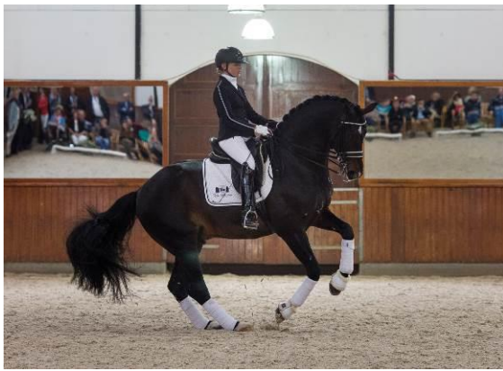
DVB Days of Dressage: puur dressuur!

Kosten DVB Days of Dressage: 200 euro voor de eerste dag (exclusief BTW), voor meerdere dagen maken wij een prijsopgave voor u.