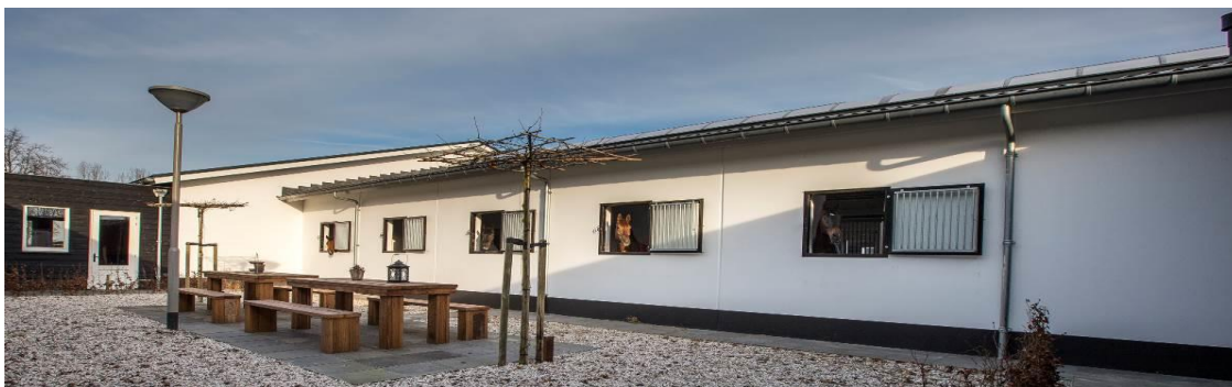
Voor uw paard is er een luxe, lichte, ruime stal (met naar uw wens stro of zaagsel) met buitenluik!